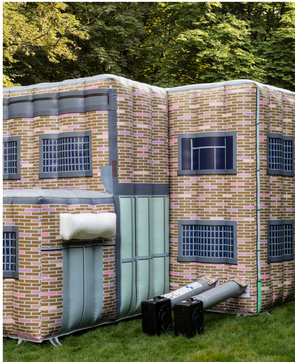
38. WOW19: Publiek Park