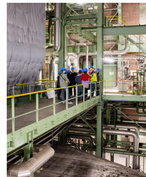
3. Chimney To Chimney, Gent