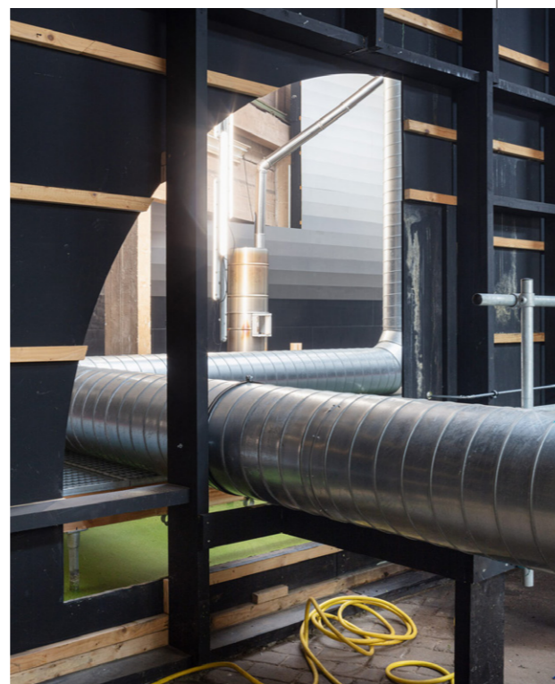
1. Radiator, 019 Gent