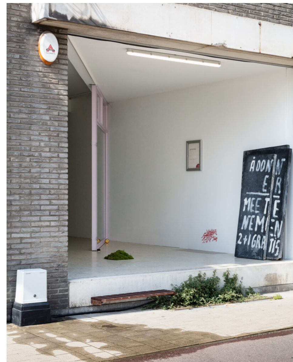
2. Entrouverte, LLS Paleis, Antwerpen