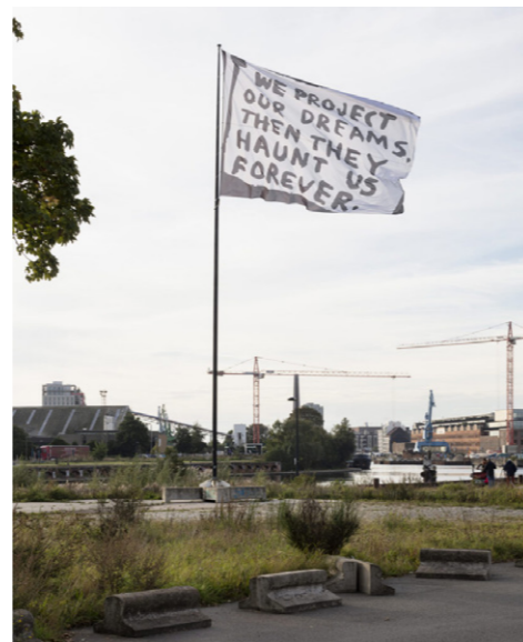
11. Driton Selmani, Alchemy, Gent

Billboard Series Budabrug is een langdurig kunstproject in de Kortrijkse publieke ruimte. Elke drie maanden toont een kunstenaar een werk. Via wisselende presentaties wil Billboard Series een duurzame en productieve dialoog opbouwen met