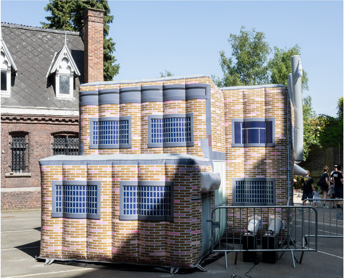
37. W0W19, Roubaix, France