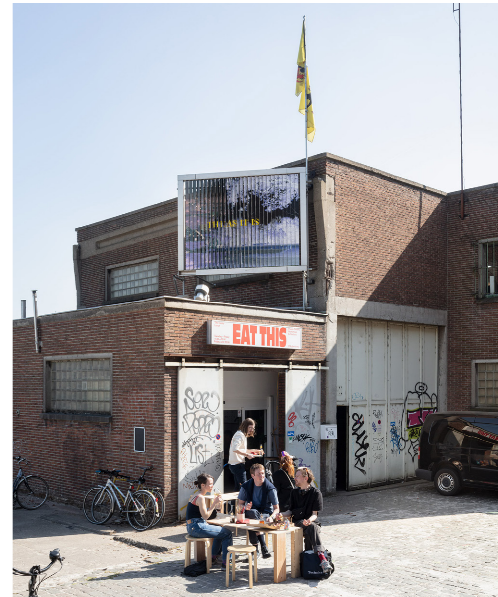
EAT THIS: een experimentele kookomgeving in 019, Gent