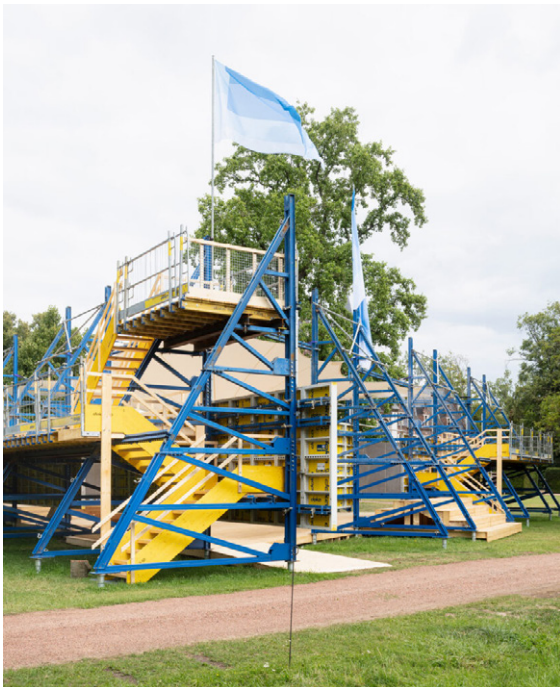
5. Flora, Elewijt