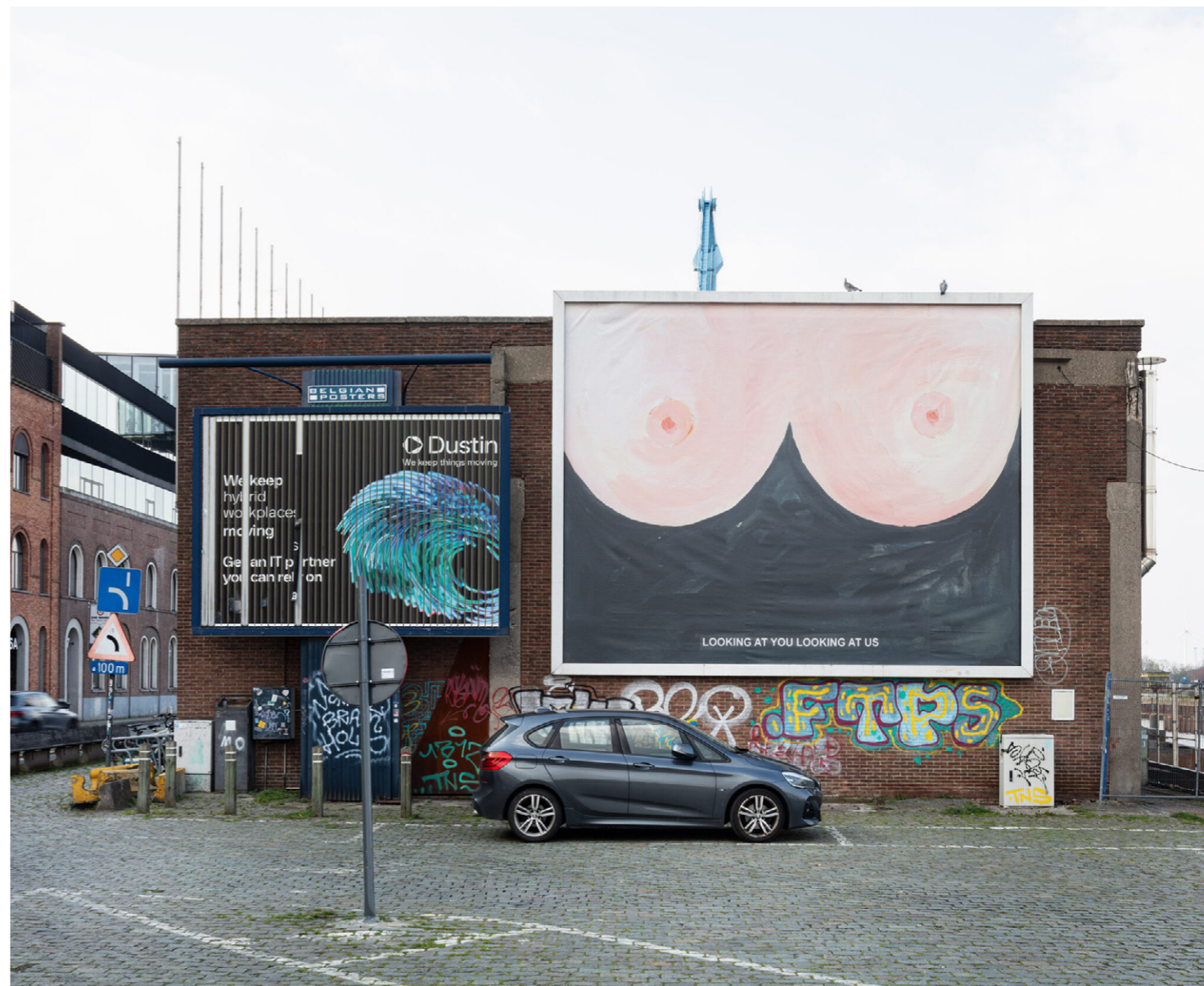
24. Laure Prouvost, Looking at you looking at us, 019, Gent