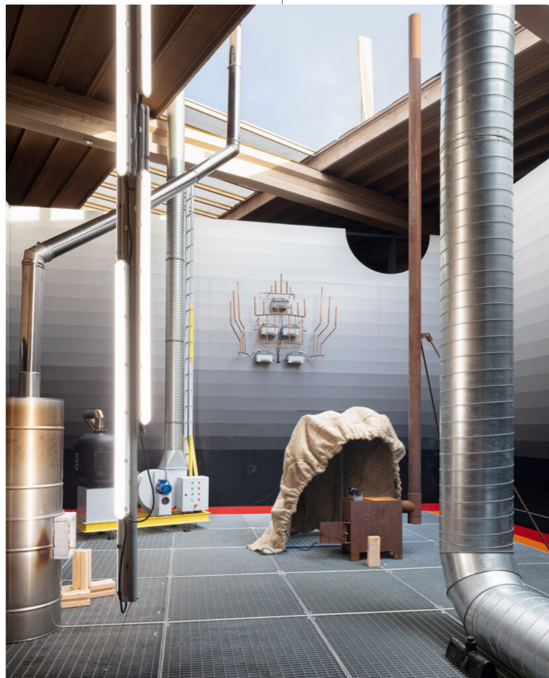
1. Radiator, 019 Gent

De site in Elewijt is een complex weefsel van verhalen en sporen.