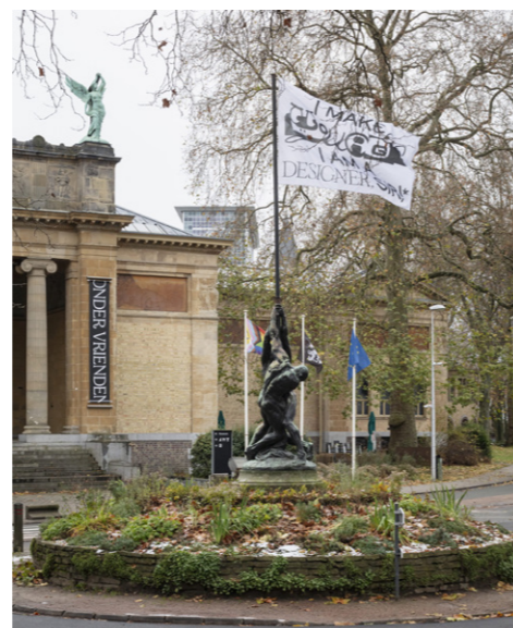
22. D-E-A-L, I Make Collages! I am A Designer, Sir!*, Gent