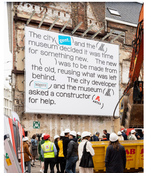
Studio Grafisch Ontwerp, Ran De Vos & Bruno Jacoby, Design Museum Gent