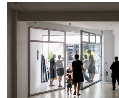
2. Entrouverte, LLS Paleis, Antwerpen