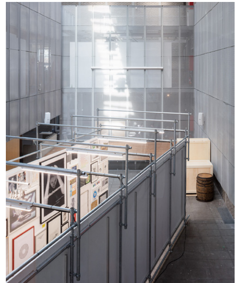
36. The Serving Library, PXL, Hasselt