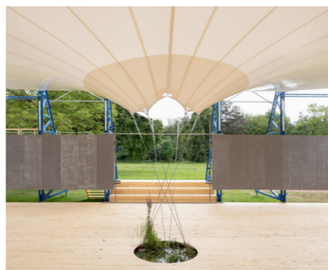
5. Flora, Elewijt