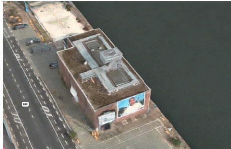
019, Dok-Noord 5L, 9000 GENT-BE

CONTACTEER ONS VOOR MEER INFORMATIE OF TOEKOMSTIGE SAMENWERKINGEN CONTACT US FOR MORE INFORMATION OR FUTURE COLLABORATIONS info@019-ghent.org