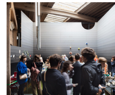
4. Athena! Clay Fair, 019 Gent