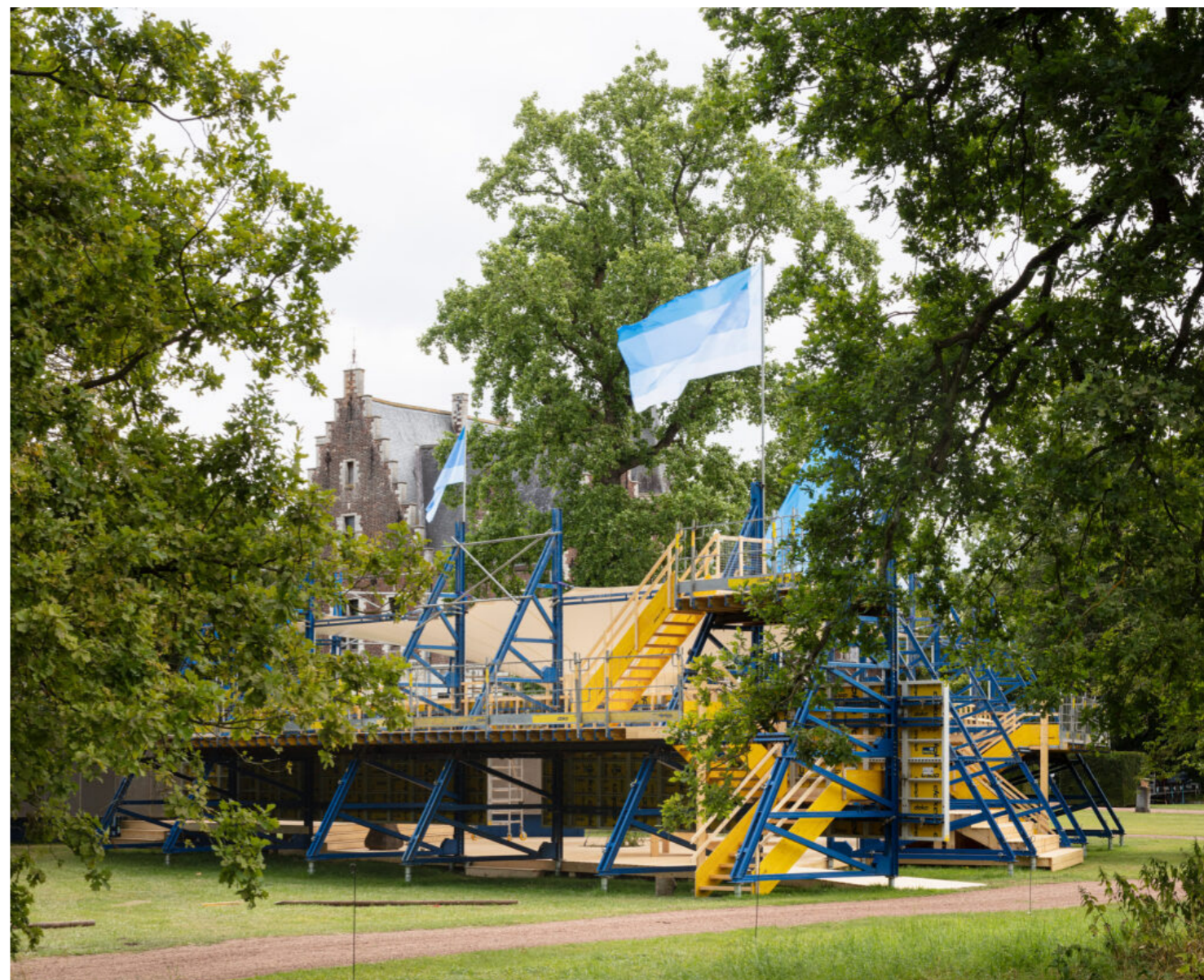
5. Flora, Elewijt